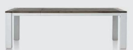
art. nr. 24719 Uitschuiftafel (+ 60 cm) bxhxd 160/220x77x100 cm