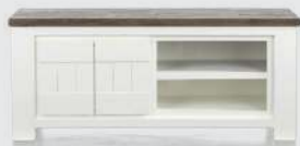
art. nr. 24694 TV-dressoir 2-deuren + 2-niches bxhxd 130x55x45 cm