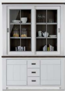
art. nr. 24705 Buffetkast 2-schuifdeuren + 2-deuren + 3-laden bxhxd 160x220x35/45 cm