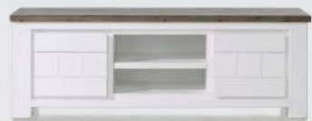
art. nr. 24693 TV-dressoir 2-deuren + 2-niches bxhxd 160x55x45 cm