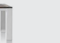
art. nr. 24716 Eetkamertafel bxhxd 220x77x100 cm