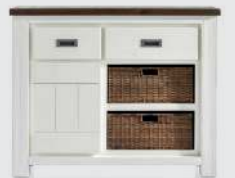
art. nr. 24706 Kommode 1-deur + 2-laden + 2-manden bxhxd 106x85x40 cm