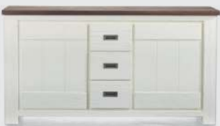
art. nr. 24723 Dressoir 2-deuren + 3-laden bxhxd 160x85x45 cm