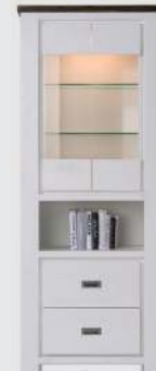
art. nr. 24697 Vitrine hoog 2-glasdeuren + 2-laden + 1-niche (+HALOGEEN) bxhxd 80x200x40 cm