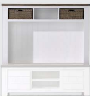
art. nr. 24703 TV-opzetkast 2-manden (+24693) bxhxd 160x110x35 cm