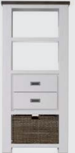
art. nr. 24696 Boekenkast laag 2-laden + 3-niches + 1-mand bxhxd 75x165x35 cm