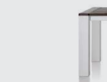
art. nr. 24704 Eetkamertafel bxhxd 160x77x90 cm