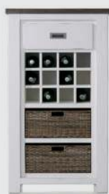
art. nr. 24707 Wijnkast 1-lade + 2-manden + 12-wijnvakken bxhxd 69x121x40 cm