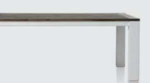
art. nr. 24718 Uitschuiftafel (+ 60 cm) bxhxd 190/250x77x100 cm