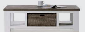
art. nr. 24700 Salontafel 1-mand T&T + 2-niches bxhxd 130x40x70 cm