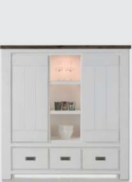
art. nr. 24698 Highboard 2-deuren + 3-laden + 3-niches (+HALOGEEN) bxhxd 140x145x45 cm