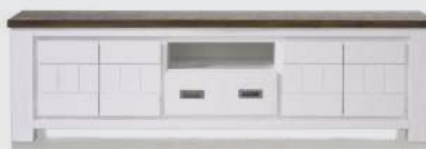
art. nr. 24692 TV-dressoir 4-deuren + 1-lade + 1-niche bxhxd 190x55x45 cm