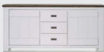
art. nr. 24691 Dressoir 2-deuren + 3-laden bxhxd 190x85x45 cm