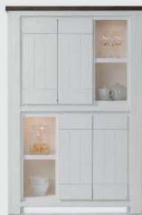
art. nr. 24699 Bergkast 4-deuren + 4-niches (+HALOGEEN) bxhxd 110x165x45 cm