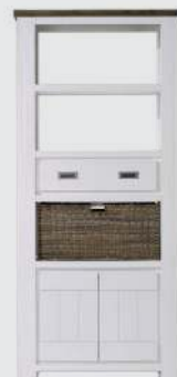
art. nr. 24695 Boekenkast hoog 2-deuren + 1-lade + 3-niches + 1-mand bxhxd 90x200x35 cm