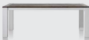
art. nr. 24715 Eetkamertafel bxhxd 190x77x100cm