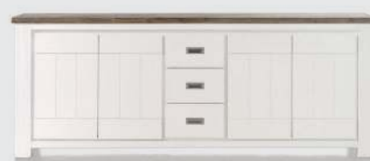
art. nr. 24690 Dressoir 4-deuren + 3-laden bxhxd 220x85x45 cm