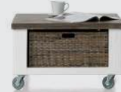
art. nr. 24701 Hoektafel 1-mand T&T + wielen/houten poten bxhxd 70x40x70 cm