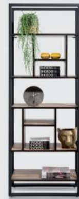
art. nr. 42443 Roomdivider 70 cm. - 11-niches (KNOCK-DOWN) bxhxd: 70x190x35