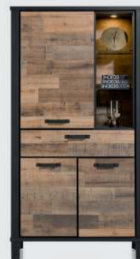
art. nr. 42451 Bergkast 100 cm. - 3-deuren + 1-lade + 3-niches (+LED) bxhxd: 100x188x42