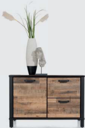
art. nr. 42440 Dressoir 130 cm. - 2-deuren bxhxd: 130x89x42