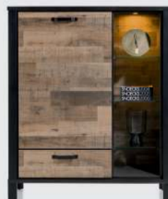
art. nr. 42455 Highboard 115 cm. - 1-deur + 1-lade + 4-niches (+LED) bxhxd: 115x138x42