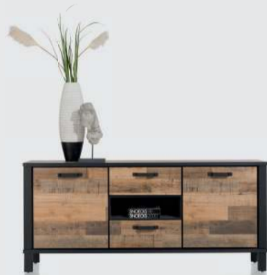
art. nr. 42441 Dressoir 180 cm. - 2-deuren + 2-laden + 1-niche bxhxd: 180x78x42