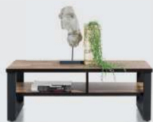
art. nr. 42446 Salontafel 60X105 cm. - 2-niches bxhxd: 60x38x105