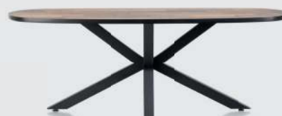
art. nr. 42448 Eetkamertafel ovaal 98X220 cm. bxhxd: 98x77x220