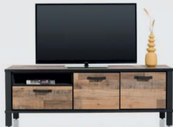
art. nr. 42445 Lowboard 170 cm. - 2-deuren + 1-lade + 1-niche bxhxd: 170x58x40