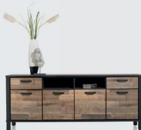
art. nr. 42442 Dressoir 220 cm. - 4-deuren + 2-laden + 2-niches bxhxd: 220x88x42