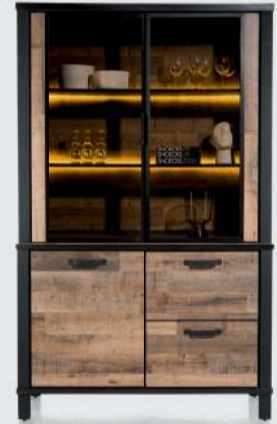
art. nr. 42454 Buffet 130 cm. - 2-deuren + 2- glasdeuren (+LED) bxhxd: 130x210x42/35