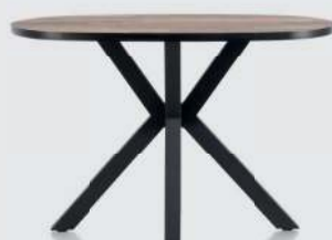
art. nr. 42452 Bartafel ovaal 98X140 cm. (Hoogte: 92 cm) bxhxd: 98x92x140