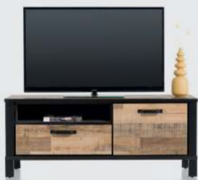
art. nr. 42444 Lowboard 140 cm. - 1-deur + 1-lade + 1-niche bxhxd: 140x58x40