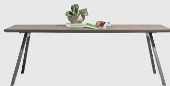
art. nr. 40727 Eetkamertafel bxhxd 190x77x95 cm