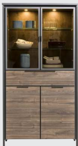
art. nr. 40726 Vitrine 2-glasdeuren + 2-deuren + 1-lade (+LED) bxhxd 100x190x44 cm