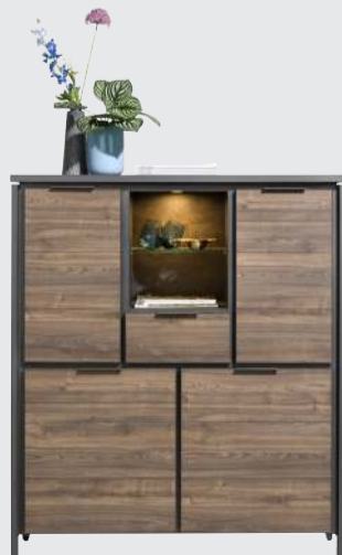
art. nr. 40724 Highboard 4-deuren + 1-lade + 2-niches (+LED) bxhxd 120x140x44 cm