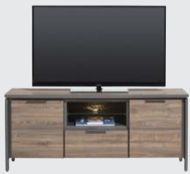
art. nr. 40722 Lowboard 2-deuren + 1-lade + 2-niches (+LED) bxhxd 140x60x40 cm