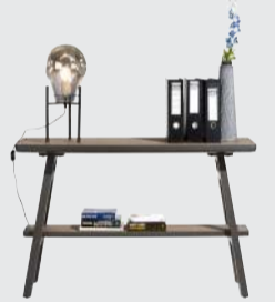
art. nr. 40733 Wandtafel 1-niche bxhxd 120x77x40 cm