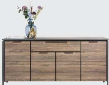
art. nr. 40720 Dressoir 4-deuren + 1-lade bxhxd 190x80x44 cm