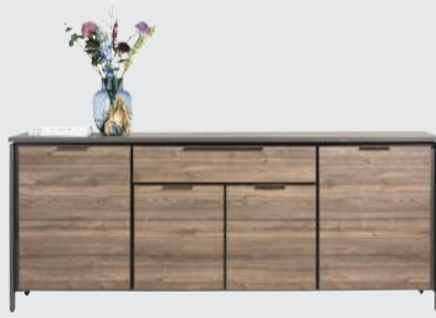
art. nr. 40721 Dressoir 4-deuren + 1-lade bxhxd 220x90x50 cm