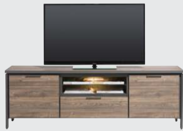
art. nr. 40723 Lowboard 2-deuren + 1-lade + 2-niches (+LED) bxhxd 180x60x40 cm