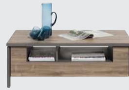
art. nr. 40731 Salontafel 1-niche bxhxd 110x40x60 cm