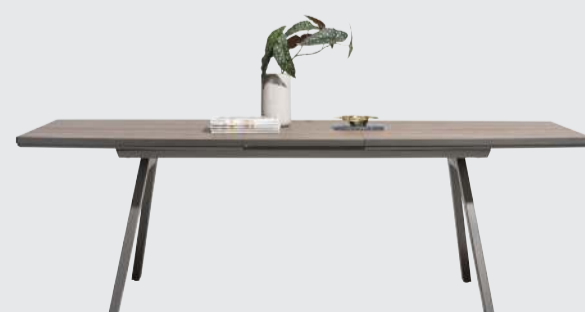
art. nr. 40729 Uitschuiftafel bxhxd 160/210x77x98 cm