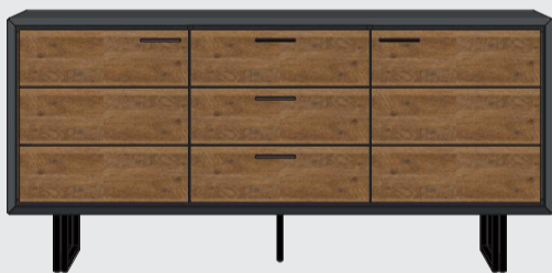
art. nr. 38796 Dressoir 2-deuren + 3-laden bxhxd 180x85x42 cm