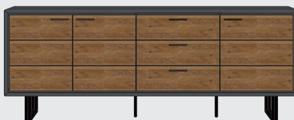
art. nr. 38795 Dressoir 3-deuren + 3-laden bxhxd 220x85x42 cm