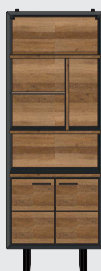
art. nr. 38801 Boekenkast 2-deuren + 5-niches bxhxd 70x190x35 cm