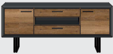
art. nr. 38797 Lowboard 2-deuren + 2-laden + 1-niche (+LED) bxhxd 140x60x42 cm