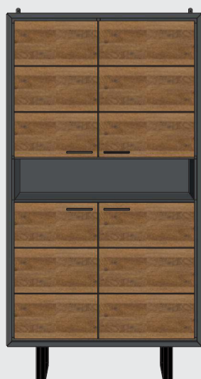
art. nr. 38800 Bergkast 4-deuren + 1-niche + LED bxhxd 100x190x42 cm