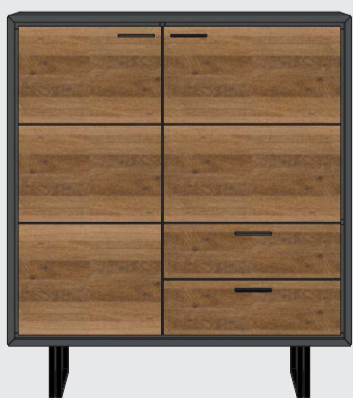
art. nr. 38799 Highboard 2-deuren + 2-laden bxhxd 125x140x42 cm