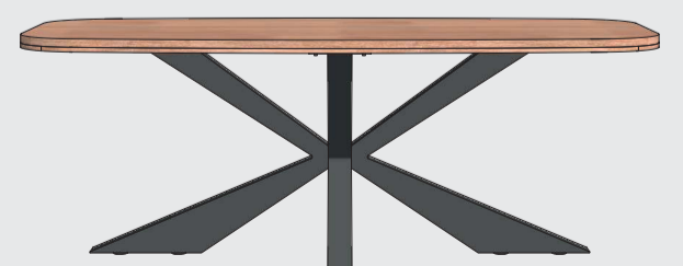
art. nr. 38809 Eetkamertafel bxhxd 180x77x100cm