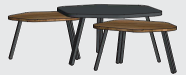
art. nr. 38803 Bijzettafel (set van 3) 1x bxhxd 80x38x60 cm 2x bxhxd 60x32x45 cm