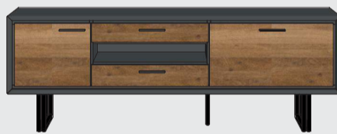
art. nr. 38798 Lowboard 1-deur + 1-klep + 2-laden + 1-niche (+LED) bxhxd 170x60x42 cm