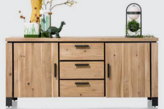
art. nr. 39625 Dressoir 2-deuren + 3-laden bxhxd 190x85x45 cm