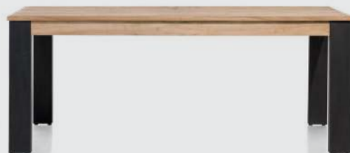
art. nr. 39632 Eetkamertafel bxhxd 160x77x100 cm