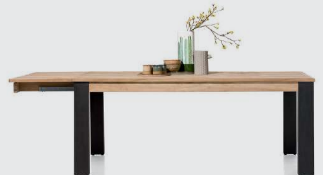
art. nr. 39635 Uitschuiftafel bxhxd 190/240x77x100 cm