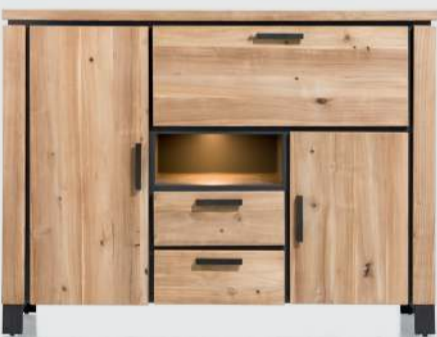
art. nr. 39629 Dressette 2-deuren + 2-laden + 1-klep + 1-niche(+LED) bxhxd 160x120x45 cm