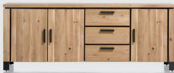
art. nr. 39626 Dressoir 3-deuren + 3-laden bxhxd 220x85x45 cm