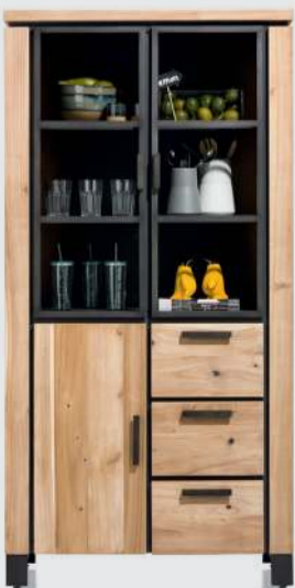
art. nr. 39630 Bergkast 2-glasdeuren + 1-deur + 3-laden bxhxd 100x200x45 cm