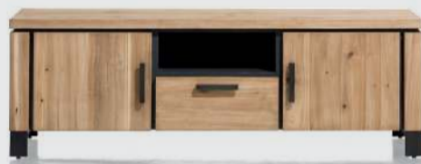
art. nr. 39628 Lowboard 2-deuren + 1- lade + 1-niche (+LED) bxhxd 180x60x42 cm