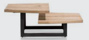
art. nr. 39631 Salontafel bxhxd 110x40x60 cm