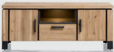
art. nr. 39627 Lowboard 2-deuren + 1- lade + 1-niche (+LED) bxhxd 150x60x42 cm